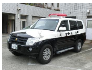
西宮警察署 (車両展示・子ども制服体験)