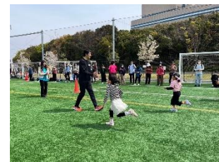
コドモ・ミーツ・スポーツ イメージ