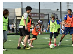
ウォーキングサッカー イメージ