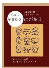
ひるね太郎 (似顔絵)