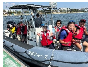
クルージング体験