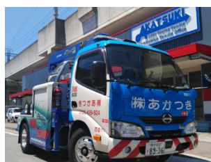
あかつきレッカー (車両展示)