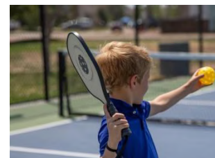
ピククルボール イメージ