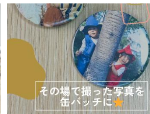
有限会社 commons (缶バッジ作り)