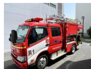
消防教室 (車両展示・水消火器体験)