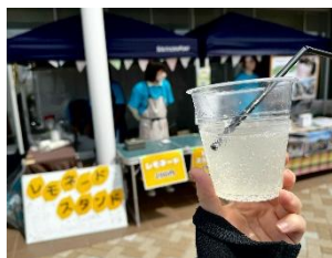
にしのみや若者応援 BANK (レモネードスタンド)