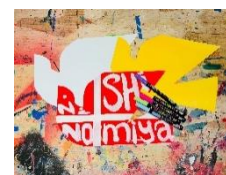
②わたしの好きな「にしのみや」 を描こう!