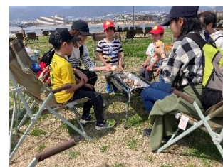
アウトドア体験 イメージ