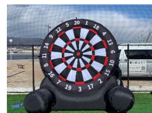
キックダーツ イメージ