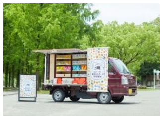
阪急百貨店スイーツカー