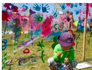
ハビネスキッズアート (ゆらゆらおさかなモビール & おててぺったん水族館アート)