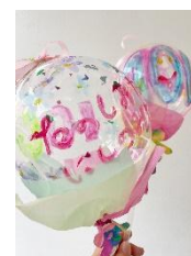
キッズアートクリエイター® (お絵描きバルーン)