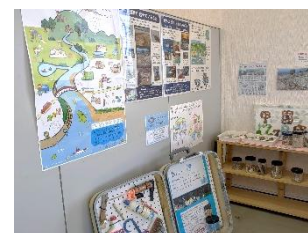
パネル展示 イメージ