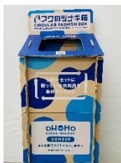
フクのツナギ箱 (不要な衣料品回収)