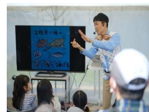
クイズショー イメージ