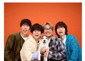
キュウソネコカミ トークショー