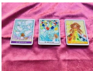
そら・うみ・ひかり (ワークショップ)