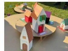
①みんなで作るわたしのまち