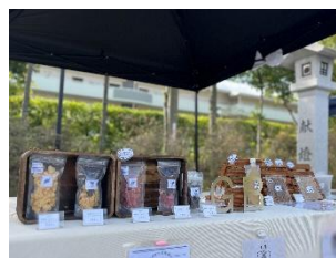
GB (ジビエペットフード)