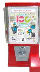
カプセルマシン イメージ