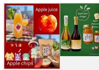
青森りんご専門店 林檎屋がはは (試飲販売)