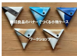
無印良品 阪急西宮ガーデンズ (小物ケース)