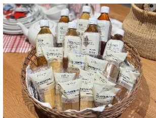
無印良品 阪急西宮ガーデンズ