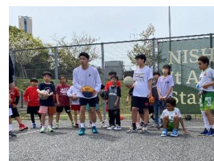
EPIC.EXE 3×3 イメージ