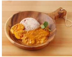
販売商品イメージ

尼崎城の目前にある芝生広場では、寒い冬にぴったりな温かいお食事などを提供するブースが出店します。 ライトアップとあわせてお楽しみください。 ※出店店舗の詳細は HP をご覧ください。