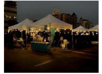
飲食ブース会場イメージ