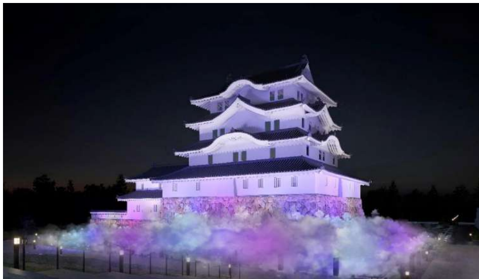
尼崎城 ライトアップイメージ

戦国時代、江戸時代、平成時代と、幾度もの困難にも負けず長い時の中で三度にわたる復活を遂げてきた尼崎城。それぞれの時代に合った場所で復活を遂げながら人々の営みを見守ってきた尼崎城の“復活”をコンセプトに、ライトアップでストーリーを演出します。